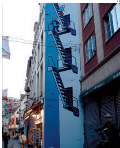
► Vinyeta de Tintin i el capità Haddock sobre un original d'Hergé (a dalt), i escena del Boule & Billy de Robe . Totes dues en façanes mitgeres de Brussel·les, el model del Comú per al projecte de la Massana.