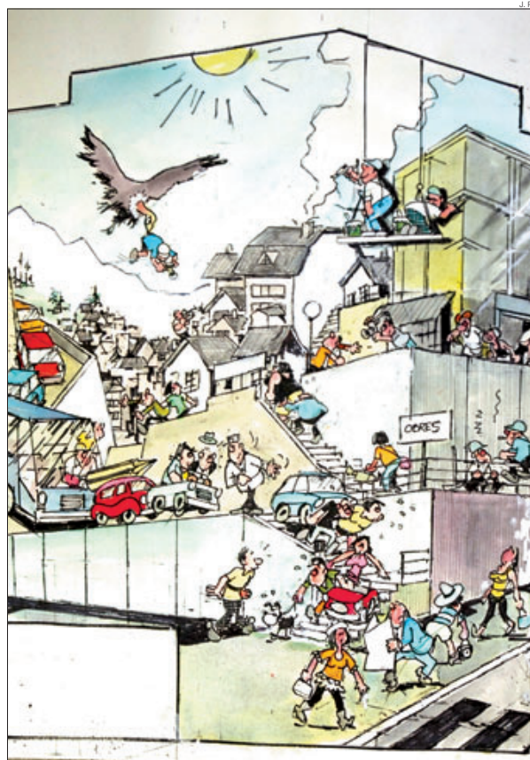
► Esbós de Blanco per a la primera façana de còmic, amb motius massanencs.

REpte tècnic // Triada la paret i creada l'escena, començarà curiosament l'etapa més complexa del projecte: traslladar la vinyeta a la façana. «No es tracta de penjar una tela, cosa