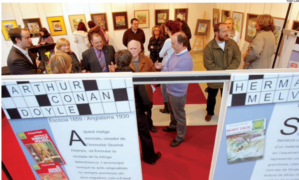
Autoritats i públic, en l'acte inaugural de l'exposició de 'Joies literàries il·lustrades', ahir a la Massana. ► Pàgina 16

La parapública reclamarà al Govern una reglamentació que afronti els impagaments